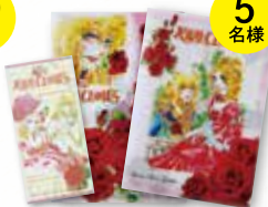
京成バラ園オリジナル ペルサイユのばら® 一筆箋・クリアファイル (A4・A5) セット