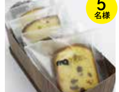
momom 焼き菓子詰め合わせ