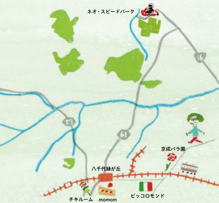
illustration / Jin Kitamura