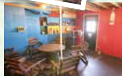
原色の壁や天井がなんとも目に鮮やかな個室スペースも。

リーズナブルでボリュームもたっぷり。ミックススタンダードコースBBQ(Aプラン)1,700円(写真は4人分)。