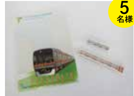
東葉高速鉄道 オリジナルグッズ 鉛筆・消しゴム・クリアファイル