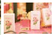
爽やかに甘いバラの香りが乙女心をくすぐります。オリジナルのオードトワレ「MOMOKA」3,300円(50ml)。