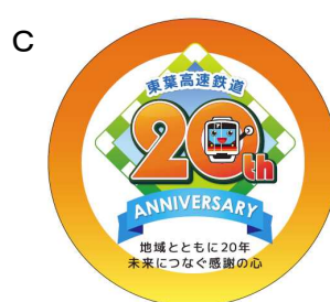
ヘッドマークデザイン