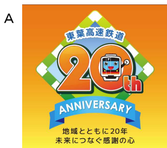
開業20周年記念ロゴ