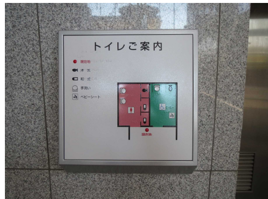
【トイレの出入口付近の触知図案内板】