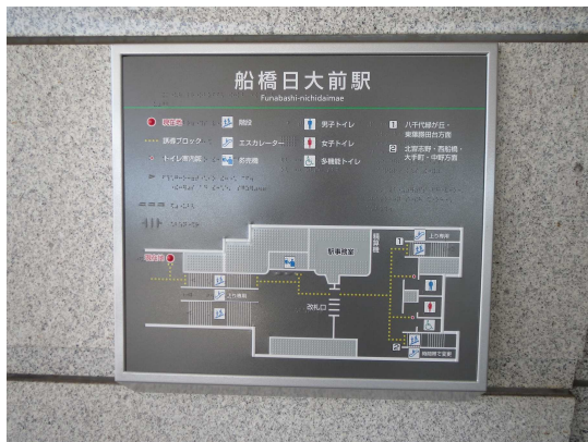
【改札口付近の触知図案内板】