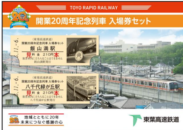
オリジナル台紙の表紙 (イメージ)