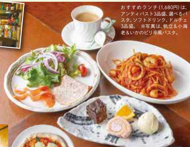
おすすめランチ(1,680円)は、アンティパスト3品盛、選べるパスタ、ソフトドリンク、ドルチェ3品盛。 ※写真は、帆立&小海老&いかのピリ辛風パスタ。