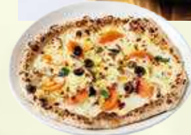
シンプルで奥深い味わいのナポリピッツアは焼きたてを提供。レモンクリームソースのピッツア(1,880円)