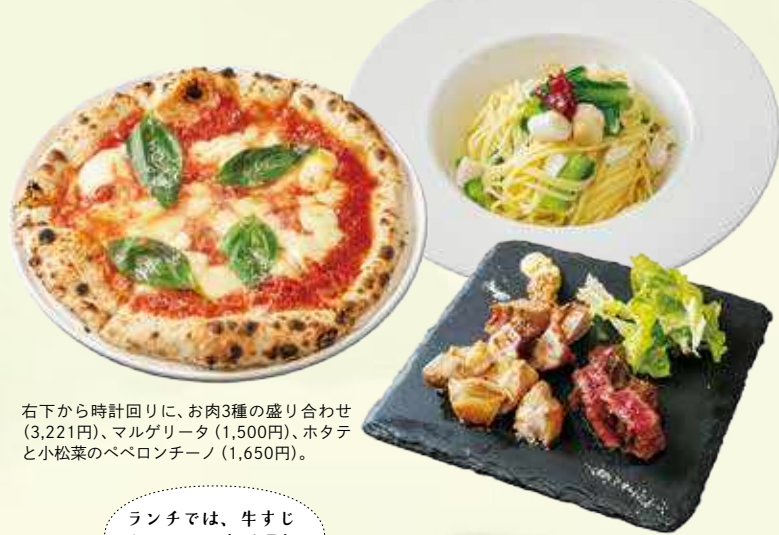
右下から時計回りに、お肉3種の盛り合わせ(3,221円)、マルゲリータ(1,500円)、ホタテと小松菜のペペロンチーノ(1,650円)。