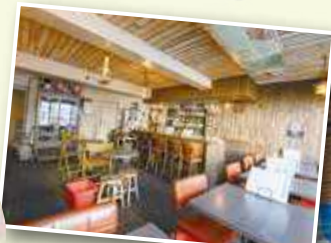
センスを感じさせる大人の空間。カウンター席もあります。