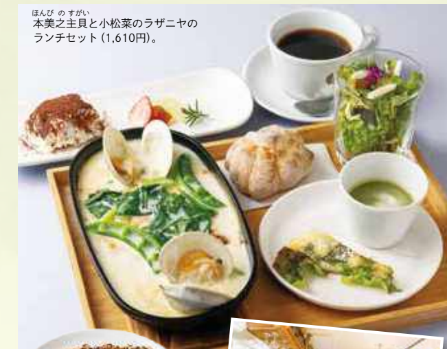
ほんびのすがい 本美之主貝と小松菜のラザニアのランチセット(1,610円)。

今回は、子どもから大人までみんな大好きなイタリア料理が登場! 焼きたてのピッツアや肉料理、おいしくてコスバ抜群のバスタランチなど、船橋エリアでおすすめのお店自慢のお料理をご紹介します。