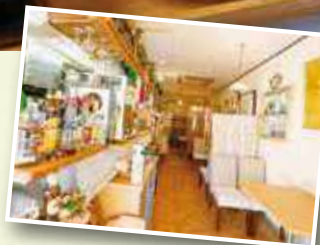
親しみやすい雰囲気の店内。家族連れのお客さまも多い。