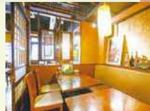
居心地のいい店内。和テイストを取り入れた落ち着いた空間も。

船橋市西船4-25-2 ●西船橋駅[北口]から徒歩1分 営 11:00 ~ 23:00 定休日 無休 ☎ 047-434-8131