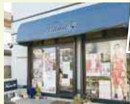
千葉ジェッツの選手やチーム関係者も通うお店です。

※1冊につき1名様1回限り有効。 (ご提示の際、右の枠内にチェックをさせていただきます。) ※有効期間: 2024年4月8日(月)~5月31日(金) ※他のサービスとの併用はできません。 ※コピー不可。