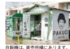
自販機は、直売所横にあります。